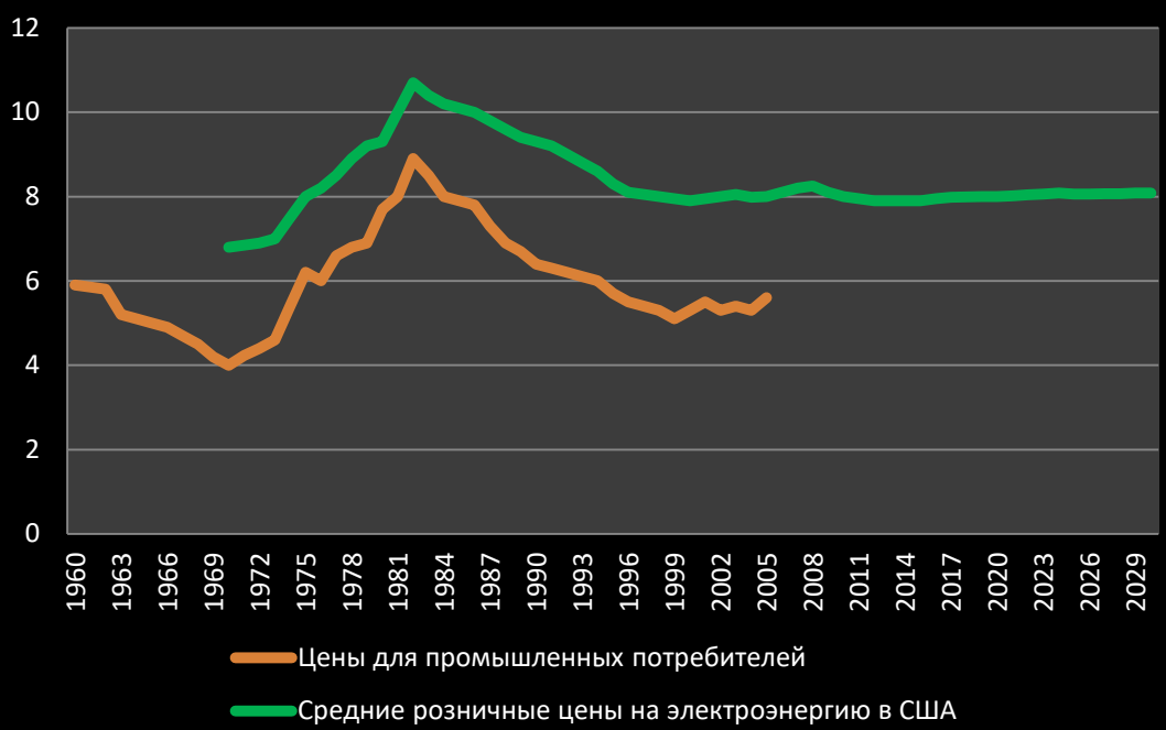
Динамика цен на электроэнергию в США для различных категорий потребителей, в ценах 2005 года года